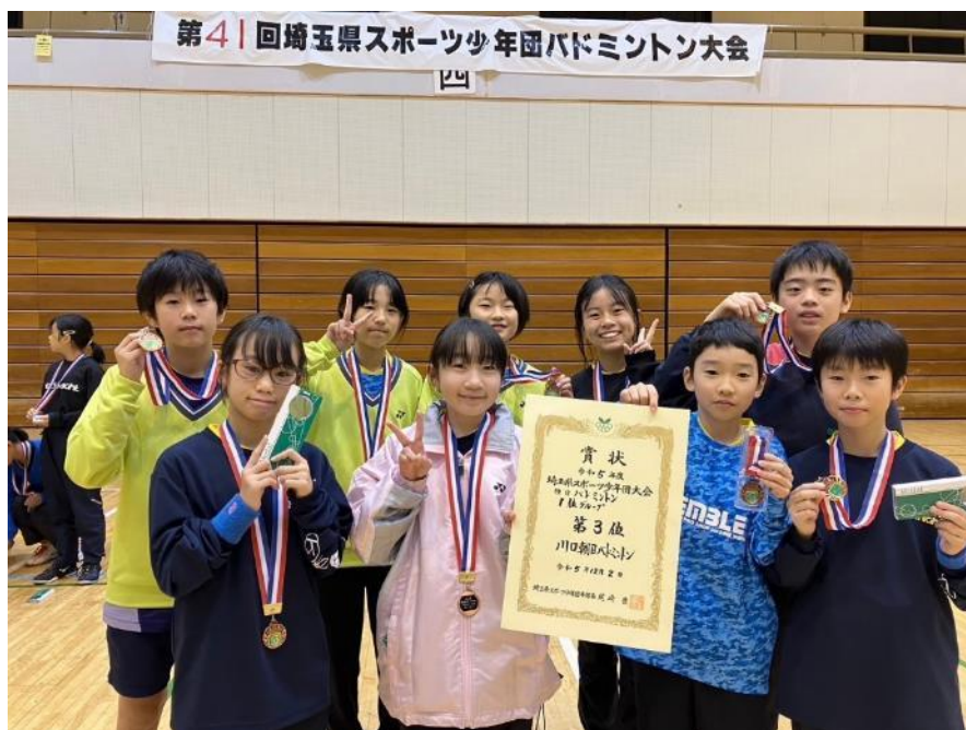
▲写真：第41回埼玉県スポーツ少年団バドミントン大会

新年が明け、1月7日には越谷市立総合体育館で「第31回越谷市小学生バドミントンオープン大会」が開催され、朝日バドミントンクラブからダブルス6ペアが参戦しました。以下の成績を収めました。