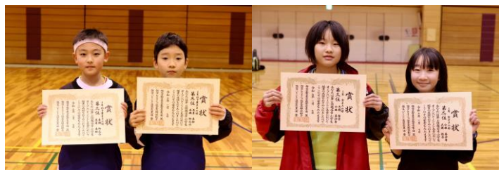
▲写真：第31回越谷市小学生バドミントンオープン大会

これら二つの大会での成果は、選手たちのみならず、監督、コーチ、サポーター、そして選手の家族の皆様の支えがあってのものです。朝日バドミントンクラブは、皆様からの温かい励ましと支援に深く感謝申し上げます。私たちは、このご支援を力に変えて、選手たちの技術向上と成長のために引き続き全力でサポートし、さらなる成果を目指して前進していきます。